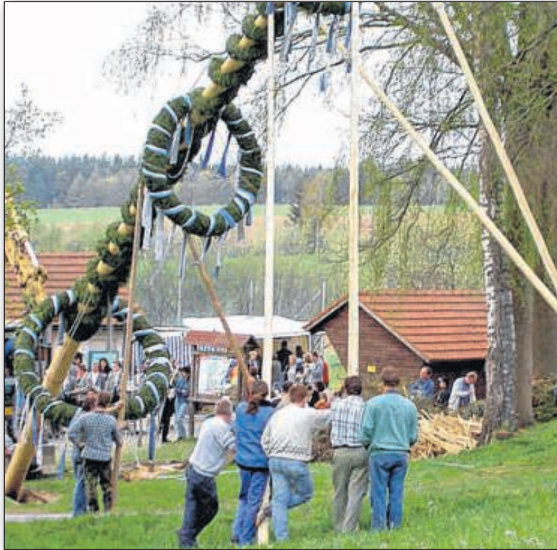
Mithilfe von Stangen wird der Baum an seinen Platz gedrückt.