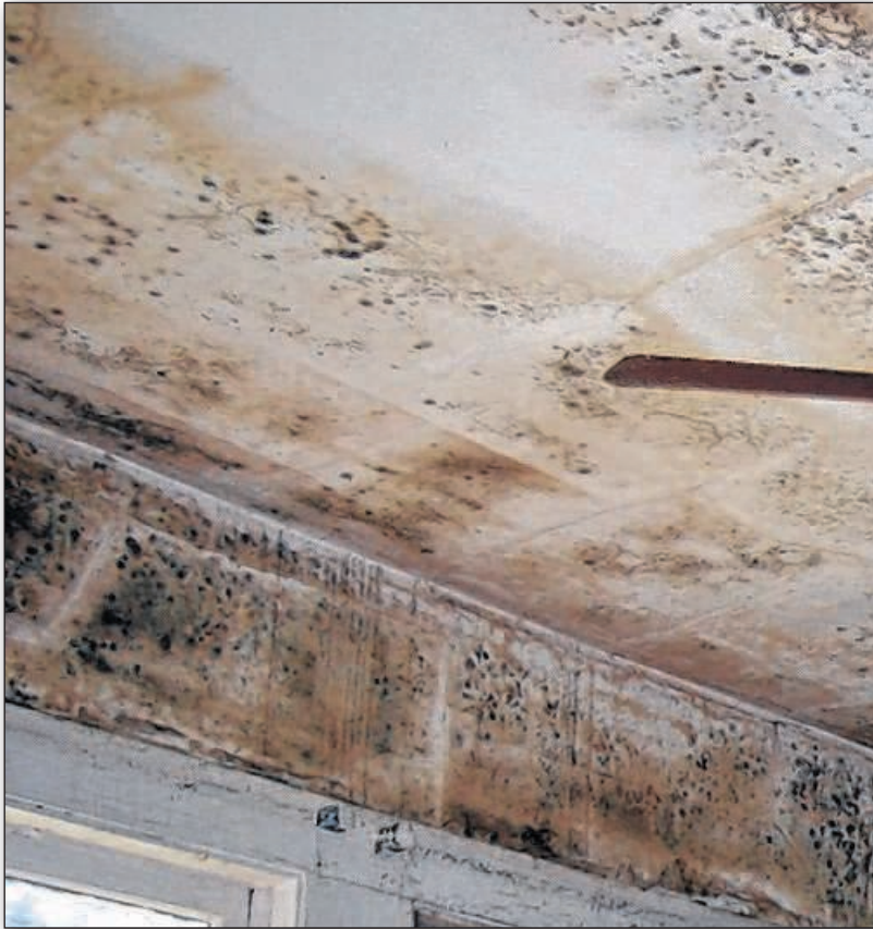
Schimmel verhinderte die Nutzung einiger Räume.