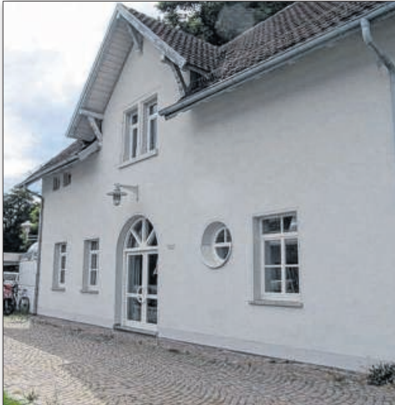
Nach der Sanierung soll der Bahnhof nun mit Leben gefüllt werden.