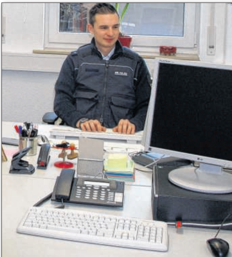
Die modernisierten Räume sind mit neuer Technik ausgestattet.

Für die Maßnahmen wurden insgesamt 500 000 Euro verbaut. Gesteuert und verantwortet wurde der Umbau vom Landesbetrieb Vermögen und Bau, der zum Finanzministerium Baden-Württemberg gehört.