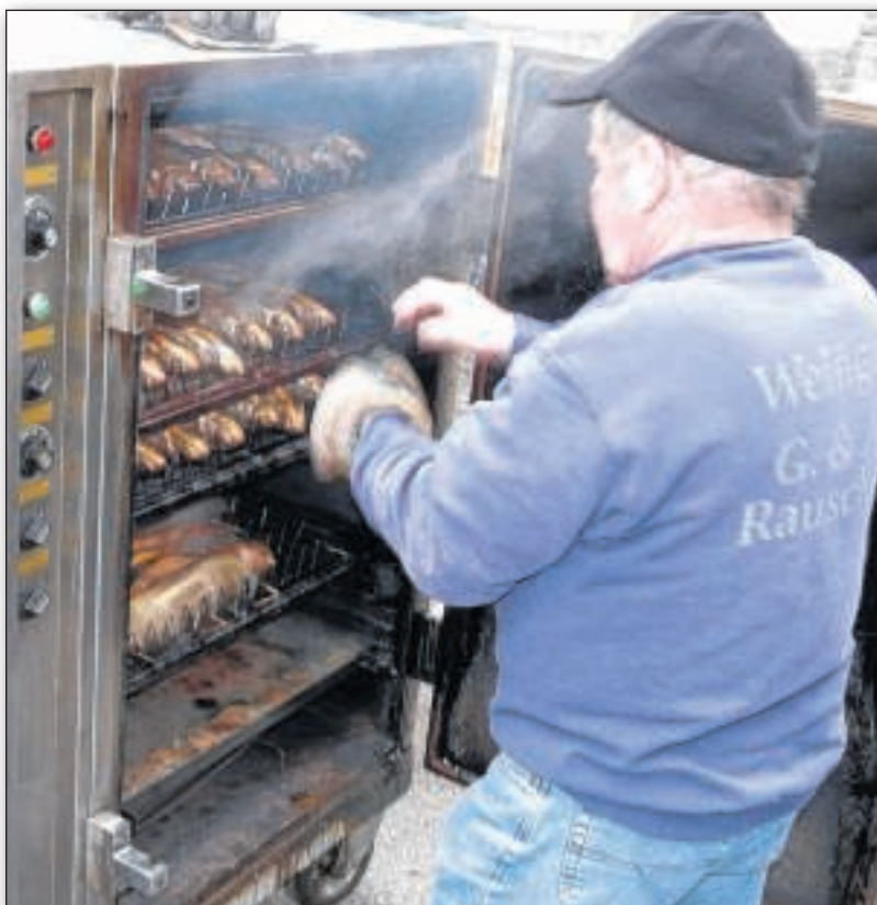
Zu Ostern gibts beim ASV wieder geräucherte Spezialitäten.

Um sicherzustellen, dass am 17. April genügend Fische zur Verfügung stehen, bittet der Verein um Vorbestellung bis Dienstag, 15. April. Weitere Informationen dazu gibt es im Internet auf www.asv-aidlingen.de . Dort besteht auch die Möglichkeit, online zu bestellen. Alternativ ist dies telefonisch unter 07034/9413 oder per E-Mail an vorstand@asv-aidlingen.de möglich. Der Verkauf findet in den Vereinsräumen in der Aidlinger Ortsbücherei statt.